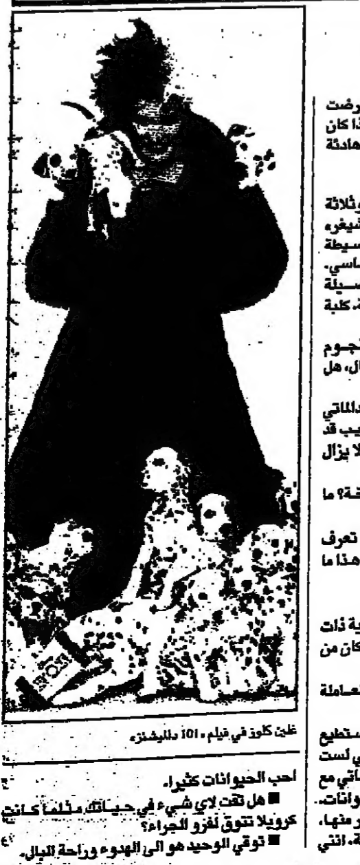
غلين كلوز في فيلم 101 دايبيشز

تقول غلين انها اعتمدت الادوار التي عرضت عليها صائفة في حياته، ولكنها لا تعرف ما اذا كان الناس يصدقون انها في الحقيقة سيدة بيت هادئة ومطبعة، ولكن، حاولوا اذا فهمتة. هل هناك حيوانات منزلية ابية؟ ثلاثة كلاب وفطشان وست سمكات وثلاثة قران وحسان ومهر، كابي الكبير اسمه تشيغيه حصلت على شركة تصوير فيلم مسارة البيسطة الطويلة... في كانباس، فهو اذن كلب كانباسي، ثم هناك دغابي، وهي كلبه نادرة من قصصنا كوتون دي توليار وتدعى ايضا كلاب الملكة كلبه ابني اني، بيل الاسكوتلندي. هل يشبه الكلب وفطشان وست سمكات وثلاثة قران وحسان ومهر، كابي الكبير اسمه تشيغيه حصلت على شركة تصوير فيلم مسارة البيسطة الطويلة... في كانباس، فهو اذن كلب كانباسي، ثم هناك دغابي، وهي كلبه نادرة من قصصنا كوتون دي توليار وتدعى ايضا كلاب الملكة كلبه ابني اني، بيل الاسكوتلندي. هل يشبه الكلب وفطشان وست سمكات وثلاثة قران وحسان ومهر، كابي الكبير اسمه تشيغيه حصلت على شركة تصوير فيلم مسارة البيسطة الطويلة... في كانباس، فهو اذن كلب كانباسي، ثم هناك دغابي، وهي كلبه نادرة من قصصنا كوتون دي توليار وتدعى ايضا كلاب الملكة كلبه ابني اني، بيل الاسكوتلندي.